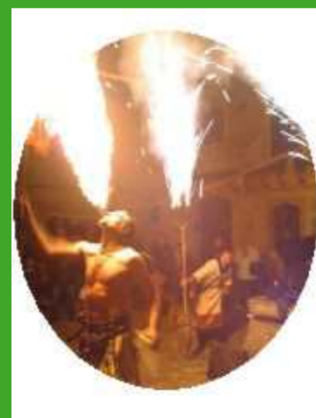
Espectaculo de circo y Fuego