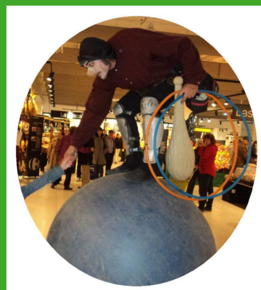
El Jorobado y su Bola Gigante