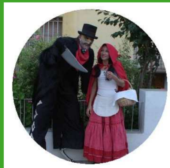
Caperucita Roja y el Lobo Feroz