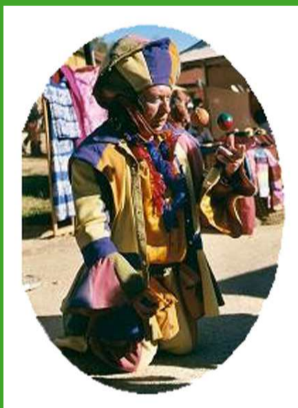
Bufon Cuenta Cuentos